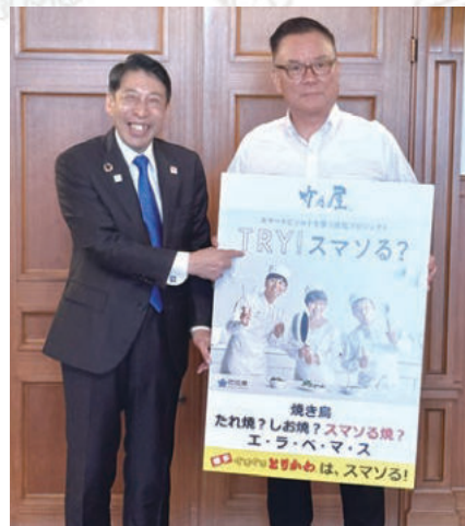
服部知事・竹野理事長

そのため、食塩の適正摂取は、高血圧の患者さんはもちろんのこと、健康な人たちにとっても大切です。