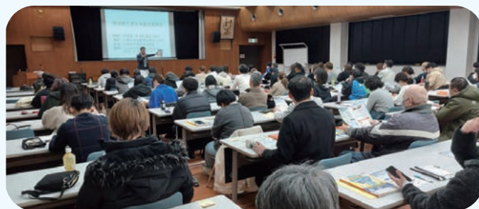
指導センター等紹介の様子(久留米会場)