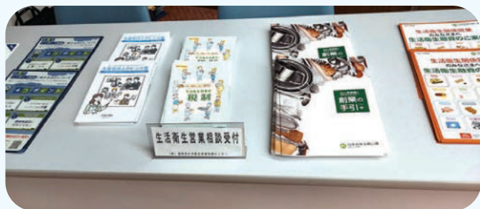
相談コーナー(久留米会場)

今後も指導センターは、地域に寄り添った相談体制をさらに充実させ、生衛業の皆さまの心強い支援役として取り組みを進めてまいります。